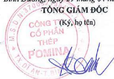
ĐỖ TIẾN SĨ